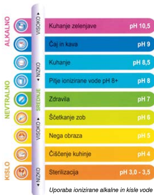
Uporaba ionizirane alkalne in kisle vode

Kronična zakisanost organizma zmanjšuje vašo naravno odpornost. Mnoge študije zakisanost organizma povezujejo z mnogimi bolezenskimi stanji. Ionizirana bazična voda je "živa voda". Ima bazičen pH in veliko število hidroksilnih ionov, zato pomaga odstraniti zakisane odpadke iz telesa.